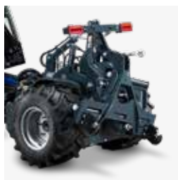
Telaio attacco ai tre punti categoria 1, oscillante 15° e spostamento laterale