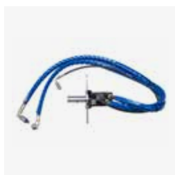
Presse di forza 1 OMS 80 cc (utilizzo di 1 pompa a pistoni)