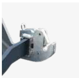
Ganci del sollevatore rapidi tipo Fendt Ø 22