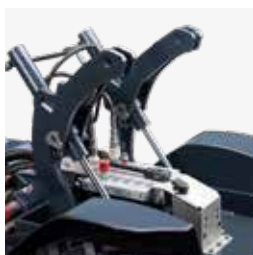
Sollevatore con distributore idraulico