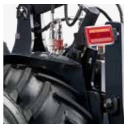
Funzione idraulica a doppio effetto (1-2-3-4)