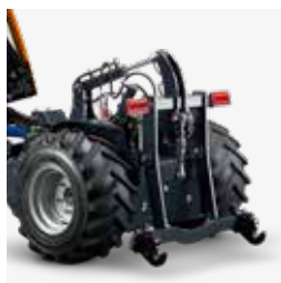
Telaio attacco ai tre punti categoria 1