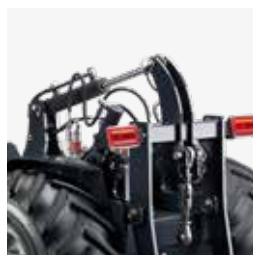
Terzo punto idraulico