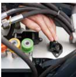
Presse commutabile 12V DIN 9680