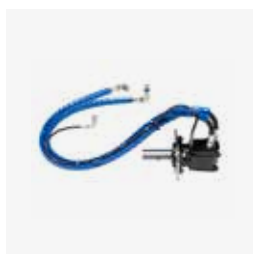
Presse di forza 2 OMT 160 cc (Per attrezzi ad alto fabbisogno di potenza, in cui la PTO è azionato da entrambe le pompe a pistoni)